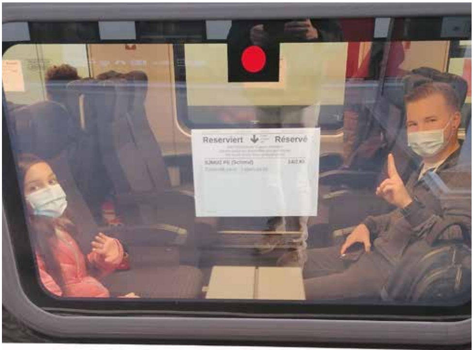
Zugfahrt mit reservierten Plätzen

Die Zugfahrt war angenehm mit reservierten Plätzen, Tickets von der SJMUZ freundlicherweise übernommen.