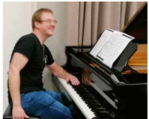
«Ionisation»: Pianist Vombi