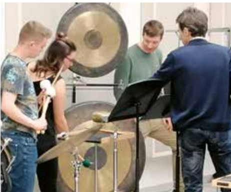
«Ionisation»: Tam Tams