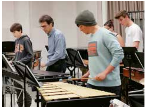
«Breaking all Illusions»