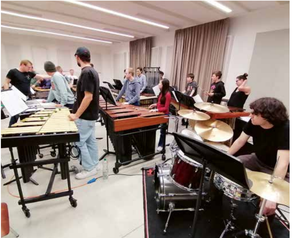
«Knights of Cydonia»: Gemeinsames Spiel mit 17 Personen