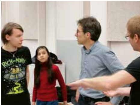
Am Fachsimpeln: Perkussionisten unter sich